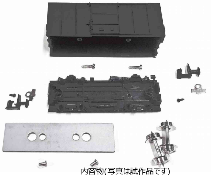
内容物(写真は試作品です)