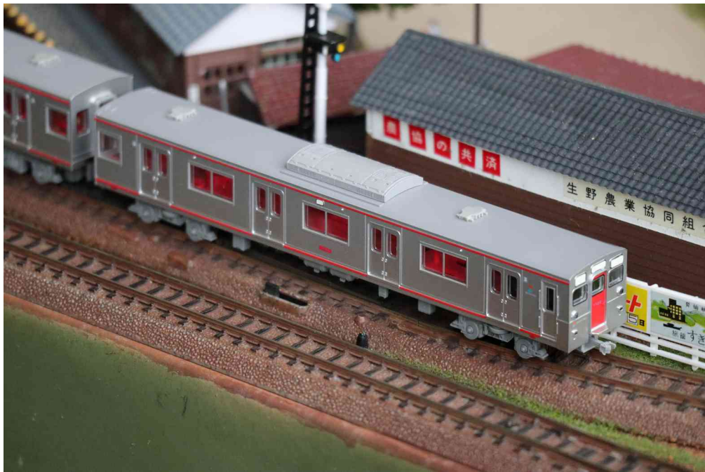
相模鉄道株式会社商品化許諾済