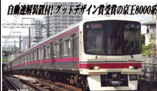
京王電鉄株式会社商品化申請中

1992年に京王電鉄は8000系を投入しました。従来の実用重視のデザインから曲面ガラスを使用した半流線型に一変、同年度のグッドデザイン賞を受賞しました。軽量ステンレス製車体、鋼製前頭部のアイボリー、京王ブルーと京王レッドの車体帯は後に京王線標準となりました。VVVFインバータ制御や車外スピーカーなどの新機軸も多数採用されました。