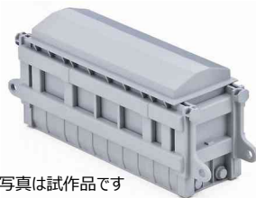
※写真は試作品です