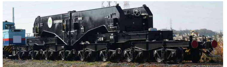
NIPPON EXPRESSホールディングス株式会社 商品化許諾済