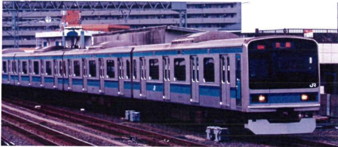
JR東日本商品化許諾済