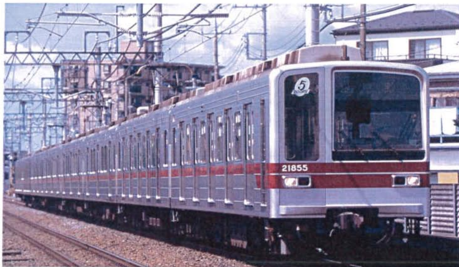
東武鉄道商品化許諾済