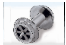
京王電鉄商品化許諾済