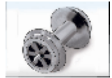
京王電鉄商品化許諾済