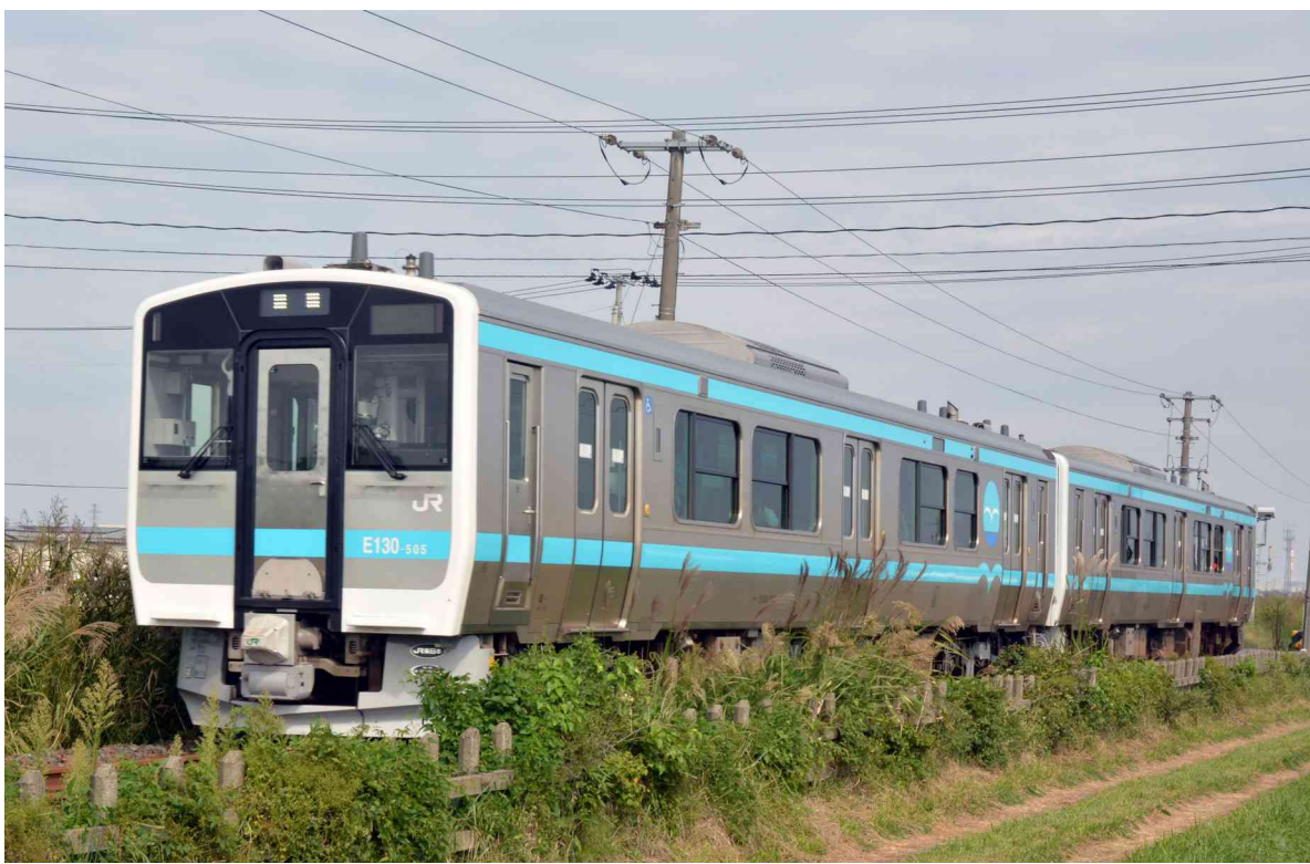
JR東日本商品化許諾済

両運転台車キハE130形の2両セットを製品化 各車屋根上にアンテナ4個、アンテナ台座、ホイッスル信号炎管各2個が並ぶにぎやかな姿を再現 0番代とは異なるスカート、アンテナ台座を再現 ヘッドライトは白色LEDを使用