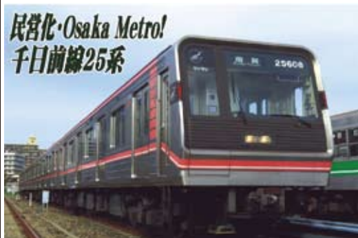
大阪市高速電気軌道株式会社商品化許諾済

大阪市交通局が1990年より投入した新20系は8年間に合計572両製造され非冷房旧型車を一掃、サービス向上に大きな役割を果たしました。