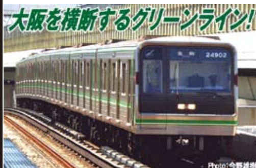
大阪市高速電気軌道株式会社商品化許諾済

大阪市交通局が1990年より投入した新20系は8年間に計572両製造され非冷房旧型車を一掃、サービス向上に大きな役割を果たしました。