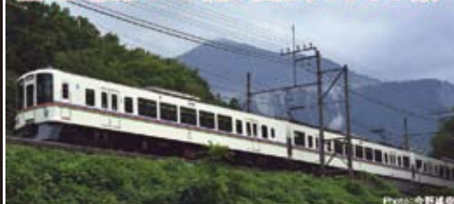
西武鉄道株式会社商品化許諾済

西武鉄道では1988年、秩父線の輸送改善、秩父鉄道線への直通運転用として4000系を投入しました。20m級片側2扉セミクロスシートの車体は普通鋼製で、前面形状は丸みを帯びた貫通型です。車体色は白を基本に赤・青・緑の帯を腰部に巻いた「ライオンズカラー」で、台車・電気機器は廃車された旧型電車のものを活用し4両編成12本が1992年までに製造されました。先頭車のうち奇数号車にはトイレ・自動販売機が設置されています。