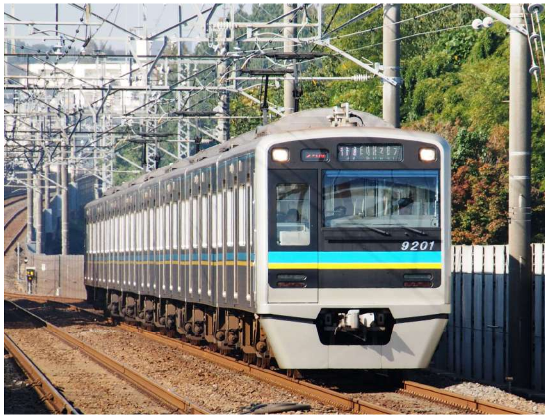
千葉ニュータウン鉄道商品化許諾済