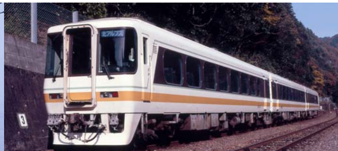
名古屋鉄道商品化許諾済