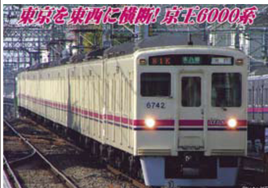
※写真はイメージです 京王電鉄商品化許諾申請中

京王電鉄では増大する旅客需要対応のため、1972年に20m級4扉の車両、6000系を投入しました。京王電鉄初のワンハンドル式運転台が採用されたほか、翌年から投入されたグループでは初めて界磁チョッパ制御が採用されるなど、輸送力増強以外にも京王線の近代化に大きな役割を果たしました。