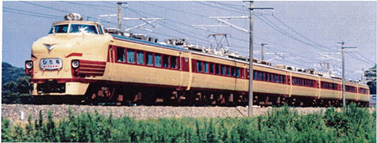
JR東日本商品化許諾済

勝田電車区 特急「ひたち」で活躍した485系！ 1998年夏、国鉄特急色に塗り戻されたK7編成を再現！ オールモノクラス編成に大きく欠き取られたスカートが特徴！