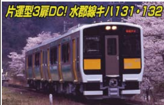
JR 東日本商品化許諾済

2007年1月、JR東日本は新型の気動車、キハE130系を投入しました。両運転台型のキハE130、片運転台型のキハE131+キハE132がそれぞれ13両ずつ、計39両が水郡線へ投入されています。車体はE231系に準じた軽量ステンレス製、扉は片側3箇所の両開き扉で、ステップが設置されてホームとの段差が少なくなる様に考慮されました。前面はFRP製で、貫通扉が設置されています。キハE131、132には久慈川と新芽をイメージした青緑色のシンボルカラーがあしらわれ、客用扉や前面帯はイエローとなりました。