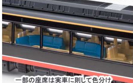
一部の座席は実車に則して色分け