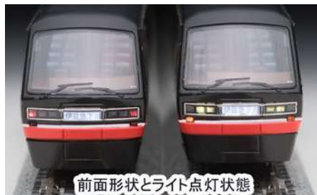
前面形状とライト点灯状態