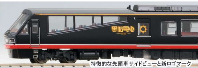
特徴的な先頭車サイドビューと新ロゴマーク