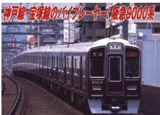
阪急電鉄商品化許諾済

神戸線・宝塚線の旧型車の置換えを目的として、2006年7月に登場したのが阪急9000系です。2003年の京都線用9300系を基本とし、神戸・宝塚線の車体限界に合わせて寸法が変更されたアルミ合金製の車体が採用され、室内は全席ロングシートとなっています。主制御器に東芝製を採用、当初から行先表示器にフルカラーLEDが採用された事や、客室ドア上の室内表示器にLCDが採用されるなど、細部が9300系と異なっています。2013年度までに8両編成11本が登場しており、神戸線用の車両と宝塚線用の車両で運用が区分されています。2013年頃からヘッドライトがLED4灯のものに順次更新されており、外見上の変化が生じました。