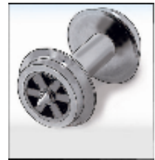
東京地下鉄株式会社商品化許諾済