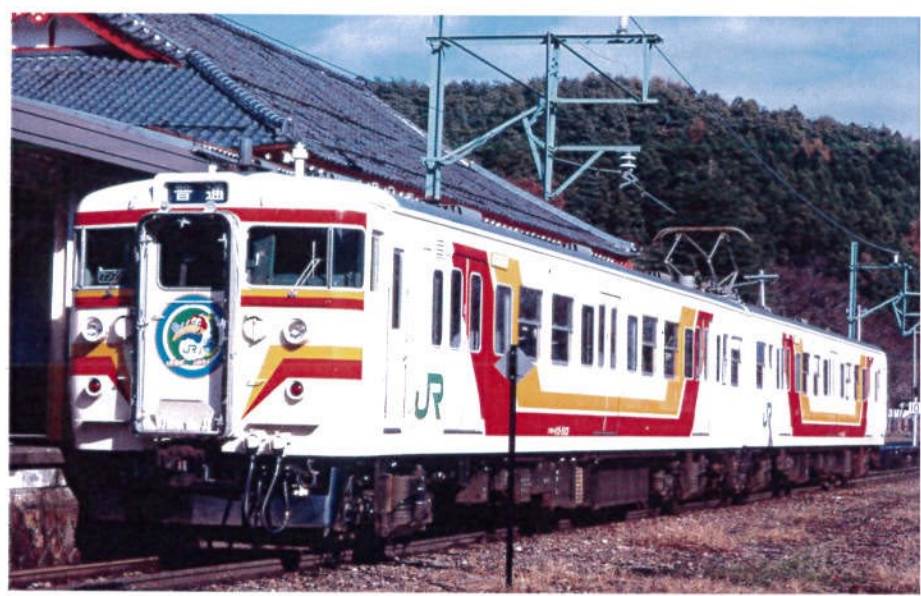
JR東日本商品化許諾済