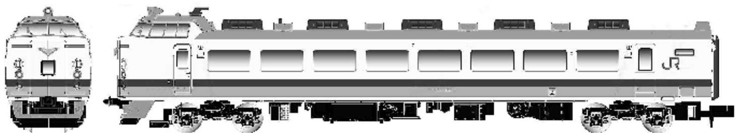
上沼垂車両所に所属したアイボリー地に腰板が青・緑のグレードアップ編成を再現。1990年頃の1500番台(本州対応改造)×3両、1000番台×4両、サロ481-100、クハ481-200で構成されたバラエティ豊かな編成を製品化。クハ481-200や大窓車を新規製作。