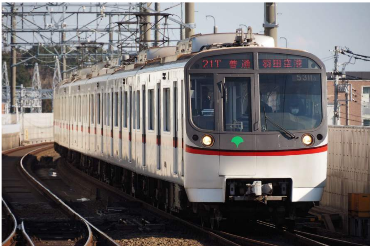
東京都交通局商品化許諾済