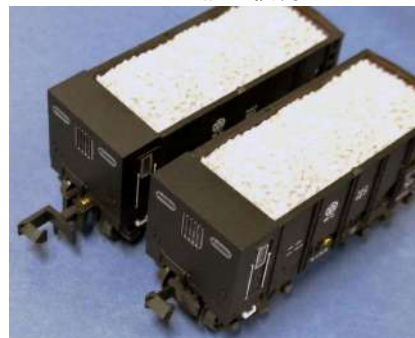
左:旧製品 右:今回製品