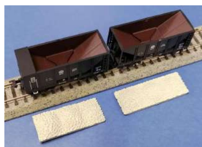
取り外し可能な積荷パーツ