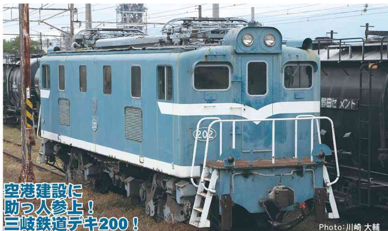
三岐鐵道の社紋と検査標記