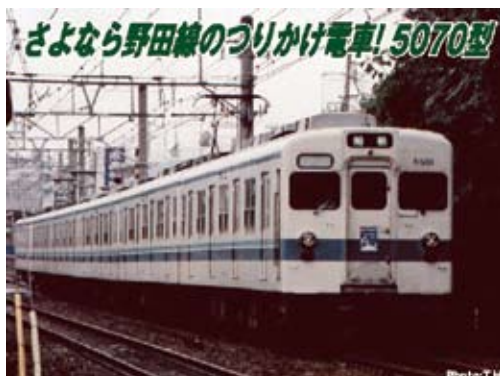
東武鉄道商品化許諾済

東武鉄道では主力として活躍した7800型の台車や電装品を活用して8000型と同等の車体を新造する更新工事を1979年から開始しました。