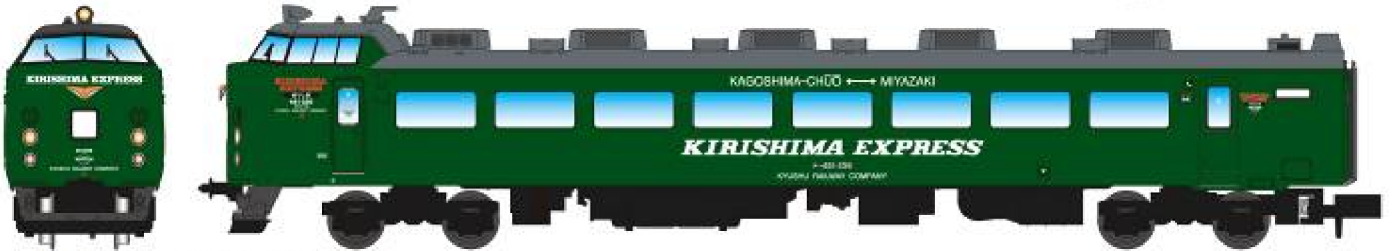
A1088 485系 特急「きりしま」グリーン塗装