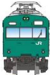
A0551 103系 0・1000番台 常磐線・エメラルドグリーン