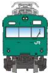
A0553 103系 0・1000番台 常磐線・エメラルドグリーン