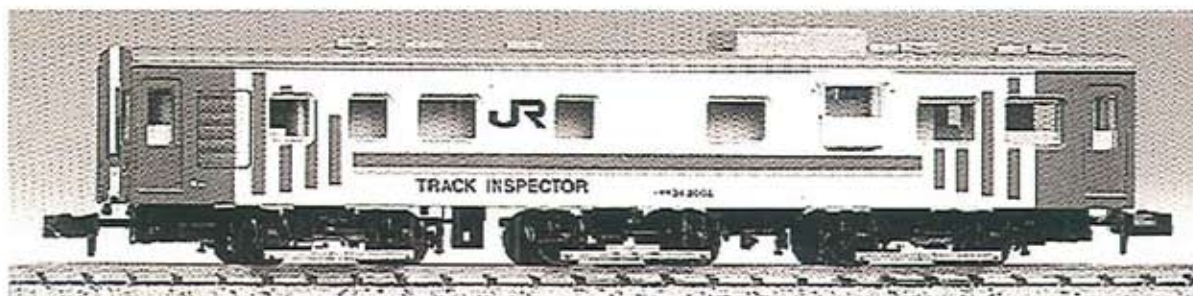
※写真は前回製品です。

商品概要 ・マイクロエース客車シリーズの更なる充実。 ・2003年6月発売のマヤ34を再生産及び新バリエーションにて発売。 ・屋根上部品、床下部品など、多数の別部品を取り付け。 ・別部品の検測装置部品を取り付けた台車。 ・テールライト点灯。ON-OFFスイッチ付き。